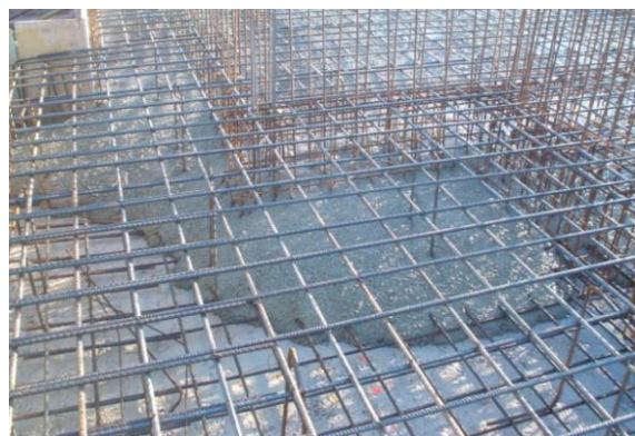
Figura 2: Hormigonado losa de cimentación