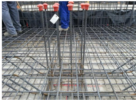
Figura 1: Ejecución de losa de cimentación