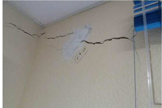
Figura 5: Cimentación en relleno. Asientos: fisuras/grietas

Causas extrínsecas , debido a variaciones producidas en el edificio o en su entorno que modifican las características existentes, por ejemplo, las construcciones en las inmediaciones no previstas que provoquen descalces de la cimentación por desconfinamiento del relleno, vibraciones, variaciones en el nivel freático, fugas o escapes de agua, etc.