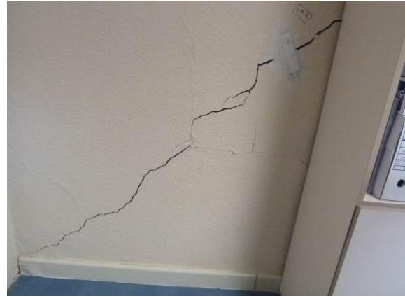
Figura 7: Fisuraciones por asientos de la cimentación

Se produce una fisura y/o grieta inclinada . Lo normal es que la fábrica se agriete en el sentido de su mayor resistencia, esto es en el sentido de la isostática de compresión. Por tanto, una grieta de asiento diferencial será inclinada descendiendo hacia la zona de terreno menos deformable.