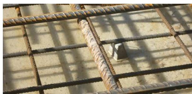
Figura 9: recubrimiento de las armaduras. Separadores