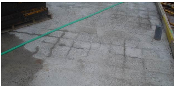
Figura 8: fisuras de retracción en losa de cimentación

El recubrimiento lateral de las puntas de las barras no será inferior a 70 mm.