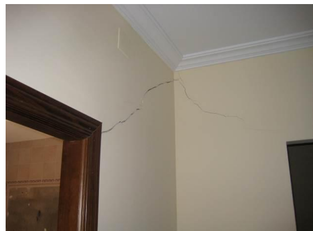
Figura 6: Cimentación en terreno expansivos: fisuras

La cimentación sobre arcillas expansivas es posible siempre y cuando se disponga de un completo estudio geotécnico, que permita al redactor del proyecto tomar las medidas adecuadas para cada situación y prever los sistemas necesarios para evitar o minimizar cualquier cambio de humedad en el terreno. Todo ello claro está, debe complementarse con la correcta ejecución y por supuesto con un mantenimiento adecuado.